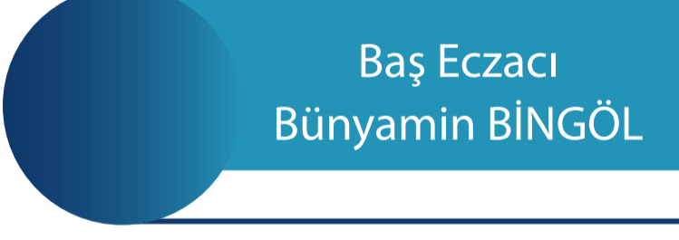
Baş Eczacı Bünyamin BİNGÖL